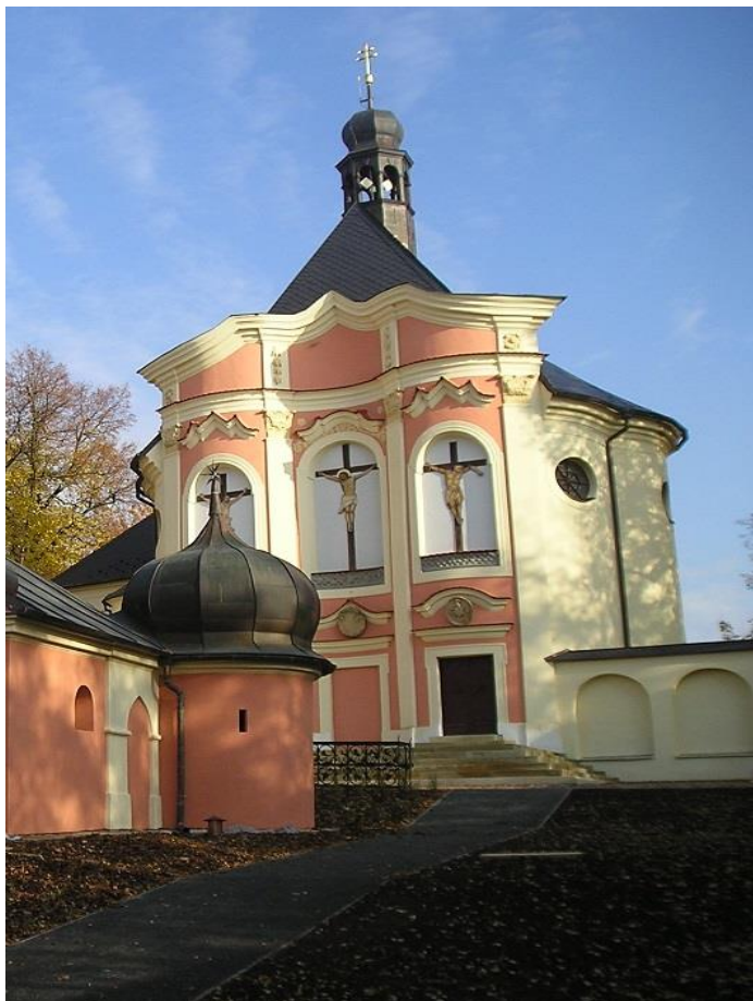
Areál po dokončení oprav v roce 2013

Od roku 2003 byly poskytnuty vlastníkově příspěvky v celkové výši 10 885 tis. Kč . Finanční prostředky byly využity účelně a hospodárně.